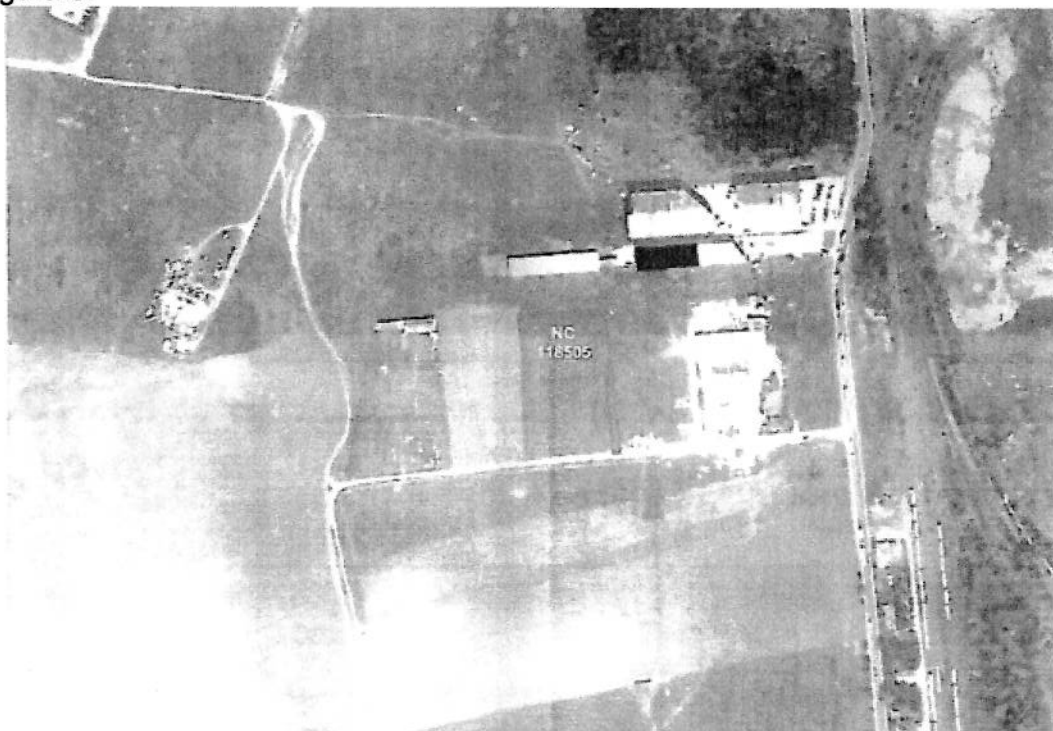
Figura 3: Plan de incadrare in zona

Vecinatatile amplasamentului sunt urmatoarele conform Planului de incadrare in zona din figura 3: